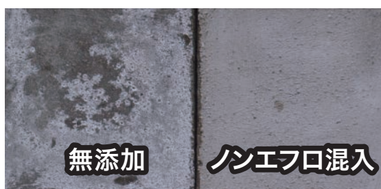
モルタルへの使用例