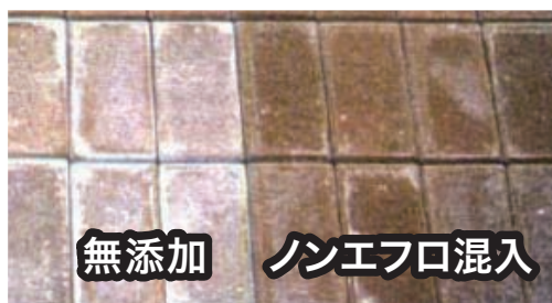
インターロッキングへの使用例